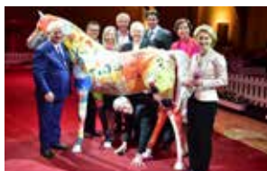
2015: Charity Veranstaltung zugunsten „Reiten gegen den Hunger“