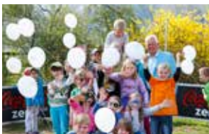
Kids & Dreams