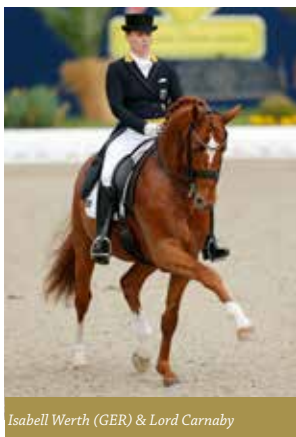
Isabell Werth (GER) & Lord Carnaby